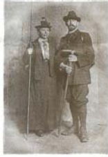
Alpine Moden: Berliner Bergbegeisterte um 1900.

Seit den 1970er-Jahren wird das „Brandenburger Haus“ vorwiegend mit dem Hubschrauber beliefert. Bis dahin zog eine elektrische Winde den Proviantschlitten über die Eisfelder des Gepatschferner, dem zweitgrößten Gletschergebiet Österreichs. Keine einfache Unternehmung: Immer wieder landete die komplette Ladung in einer der Gletscherspalten. Berliner Sektion des Deutschen Alpenvereins, Tel. 251 09 43, Markgrafstraße 11, Kreuzberg, www.dav-berlin.de