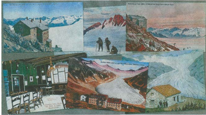
Architektonische Zeugnisse alpiner Begeisterung: Die Berliner Hütte (2 042 Meter über dem Meeresspiegel) und das Brandenburger Haus (3 277 Meter hoch gelegen) wurden auf Initiative Berliner Bergfreunde errichtet. Noch heute sind beide Hütten im Besitz des Berliner Alpenvereins.

Fassadenkletterer, Trachtentänzer und Höhenweltrkorde: Was die Hauptstadt mit den Bergen verbindet